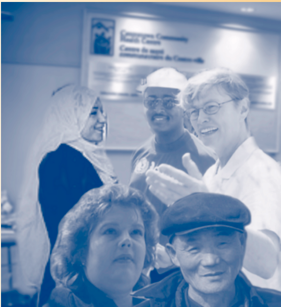
Chaque personne compte.